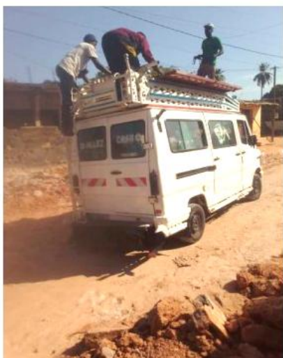
Un taxi pour Estel...